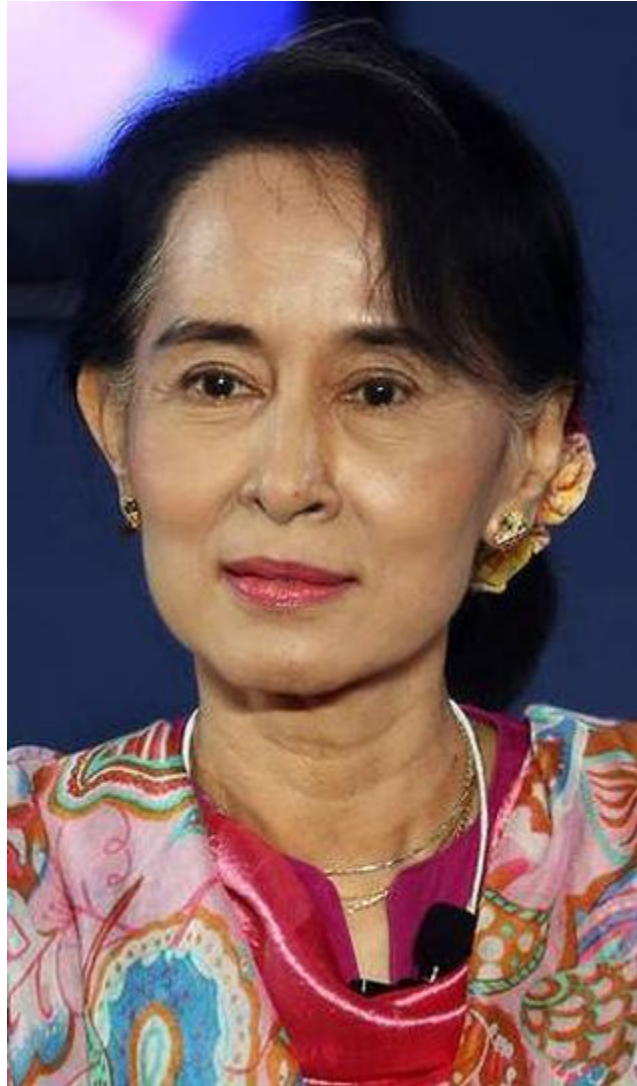
Hình 6. Bà Aung San Suu Kyi.