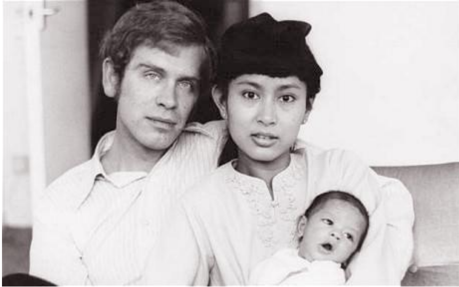
Hình 3. Nhà nghiên cứu lịch sử Michael và San Suu Kyi