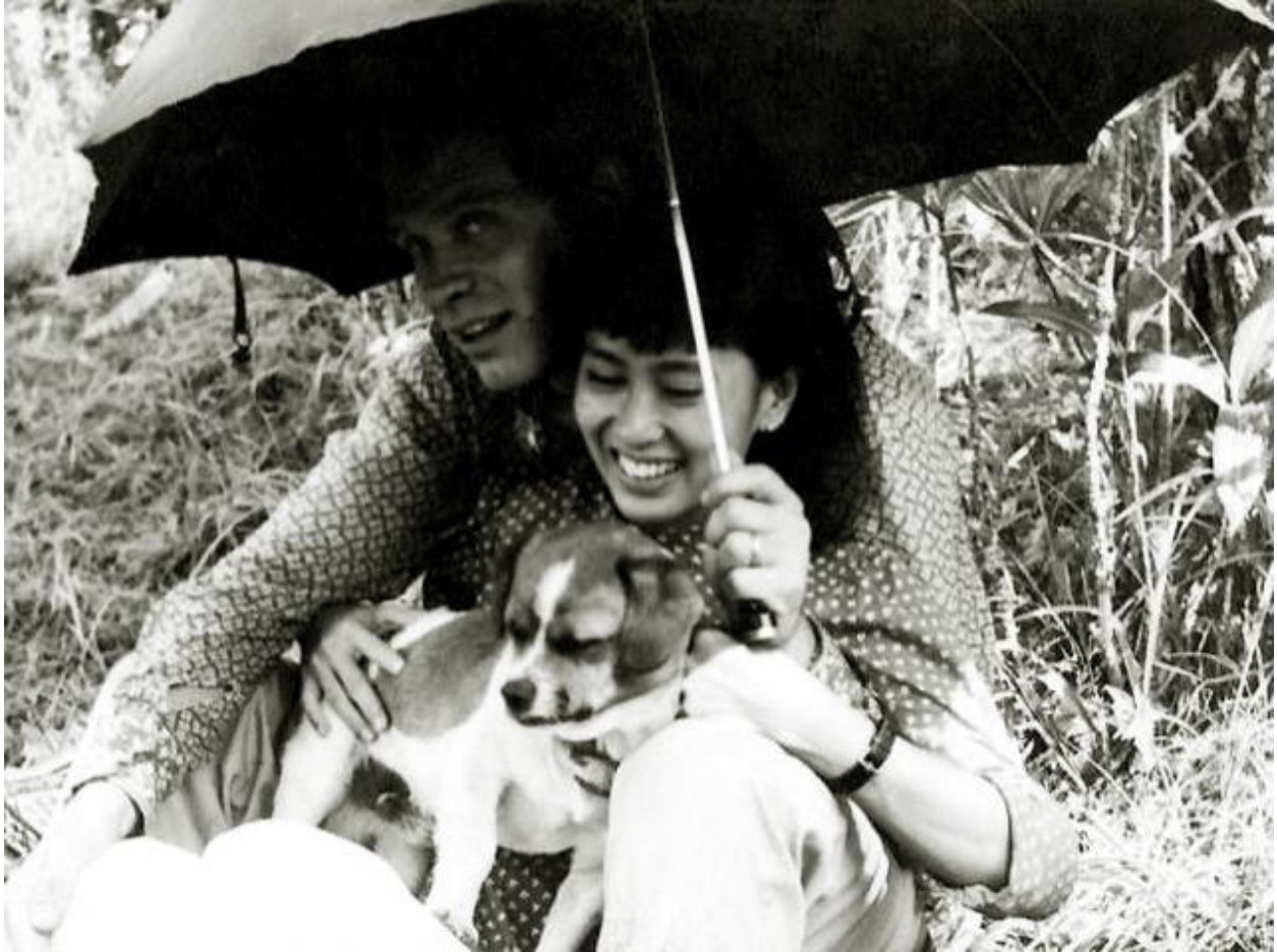
Hình 4. Nhà nghiên cứu lịch sử Michael và San Suu Kyi

Trong 16 năm kế tiếp, Suu Kyi đã giấu đi sức mạnh phi thường của bà và trở thành bà nội trợ hoàn hảo. Khi hai cậu con trai, Alexander và Kim, được sinh ra bà đã trở thành một người mẹ rất tỉ mỉ, lưu ý từng bữa tiệc sinh nhật tổ chức thật chu đáo cho con và những bữa ăn hàng ngày nấu rất tinh xảo. Nhiều khi bà làm cho các bạn bè nữ của mình phải phát bực, khi bà khăng khăng đòi ủi vớ cho chồng và tự tay lau dọn mọi thứ trong nhà mình.