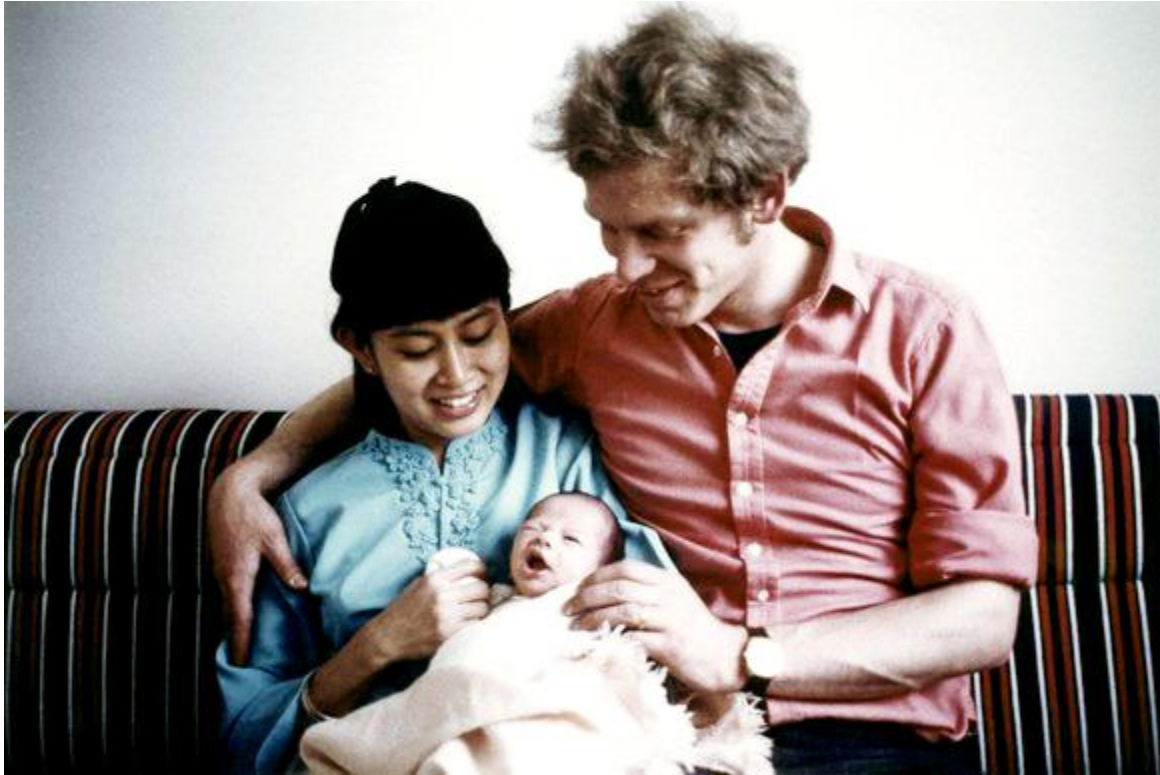
Hình 5. Bà Aung San Suu Kyi. Ảnh tư liệu.

Bà ngay lập tức bay đến Rangoon trong 1 chuyến viếng thăm dự định độ 2 tuần, chỉ để thấy một thành phố trong tình trạng hỗn loạn. Một loạt các cuộc đối đầu bạo lực với quân đội đã đưa đất nước Miến Điện đến chỗ bế tắc, và khi bà vào Bệnh viện Rangoon để chăm sóc cho mẹ , bà thấy cả bệnh viện đầy nghẹt các sinh viên bị thương và chết , vì bị bắn khi đi biểu tình. Kể từ khi các cuộc họp công cộng bị cấm, bệnh viện đã trở thành trung tâm điểm của một cuộc cách mạng không có thủ lĩnh, và tin con gái của vị anh hùng dân tộc đã trở về Miến Điện lan tỏa nhanh như 1 trận cháy rừng.