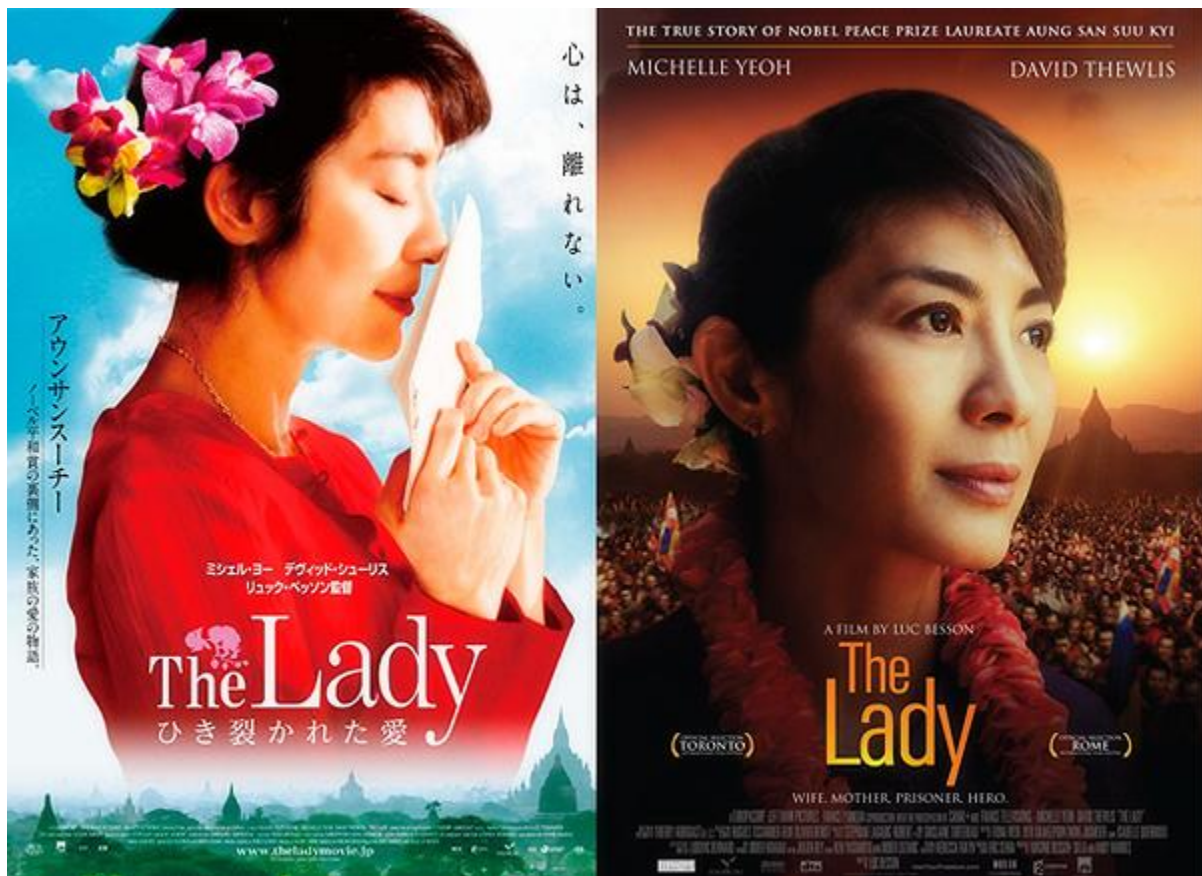
Hình 1. Áp phích bà Aung San Suu Sukyi. Ảnh tư liệu.

Khi tôi bắt đầu nghiên cứu một kịch bản phim về bà Aung San Suu Kyi bốn năm trước, tôi không bao giờ nghĩ mình lại sẽ khám phá ra 1 câu chuyện tình yêu vĩ đại của thời đại chúng ta.